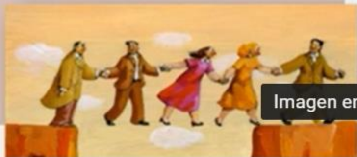
Imagen en imagen